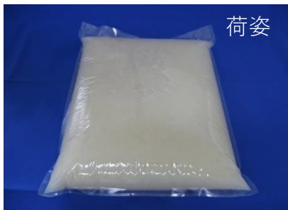
1袋10kg入りの大根おろし