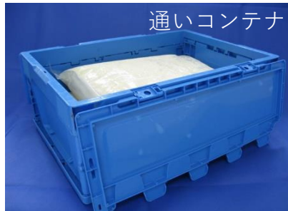
自社便などで配送可能な場合、 通いコンテナを使用しています

ある程度の量をご利用の場合、通常一般的に10kg/Pの大根おろしを通いコンテナに2～3P入れてお届けしています。大根おろしは製造日の翌日、弊社の自社便等が冷蔵冷凍車で運びお届けいたします。大根おろしは製造後、氷水ですぐに冷やしこみされますのでお届けされるまで十分冷えております。また、通いのコンテナは次回の納品時に回収し、弊社にて洗浄いたします。