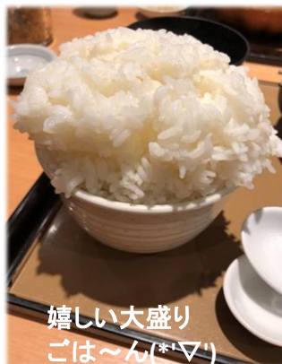
嬉しい大盛り ごはん(*▽*)

弊社に来て私を見かけた際には 是非とも美味しい御飯が食べられるお店を教えてください