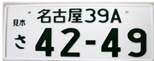
サンプルのナンバー