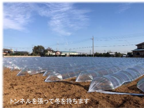
トンネルを張って冬を待ちます

よく曲がる弾力性のあるポールを土にさして、それからビニールを張りますが、このポールをさす作業が手の皮がむけたり大変なんです。(トンネルをバラす作業も大変なんです、)