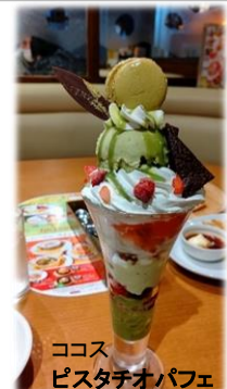
ココス ピスタチオパフェ