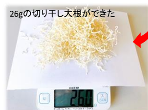
26gの切り干し大根ができた