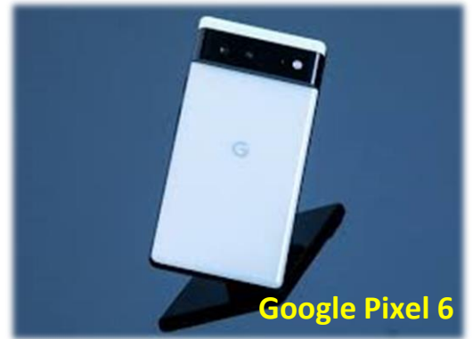
Google Pixel 6