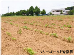
マリーゴールドを播種