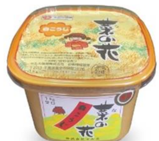
株式会社マルカさんの味噌 https://miso-maruka.com