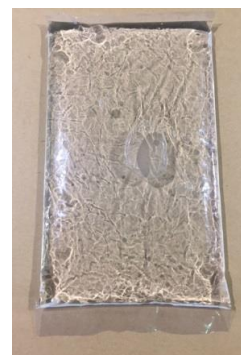
大葉と一緒に入れる水袋