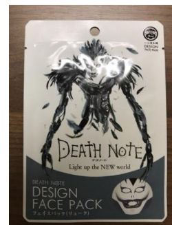
死神になれるフェイスパック