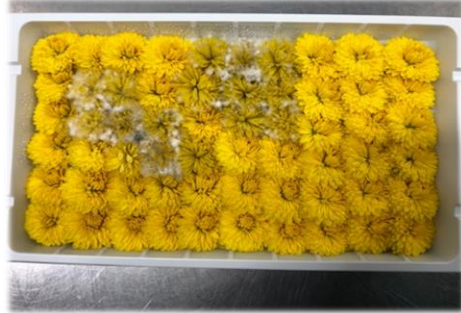
【画像2】白カビ病になってしまっている