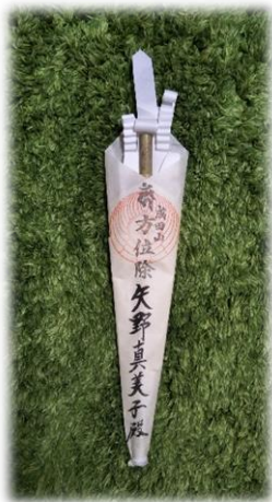
成田山でいただいた方位除