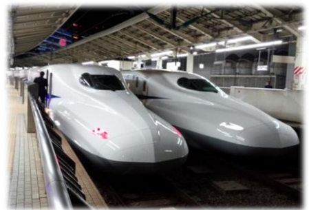
東海道新幹線のぞみ 大阪➡東京